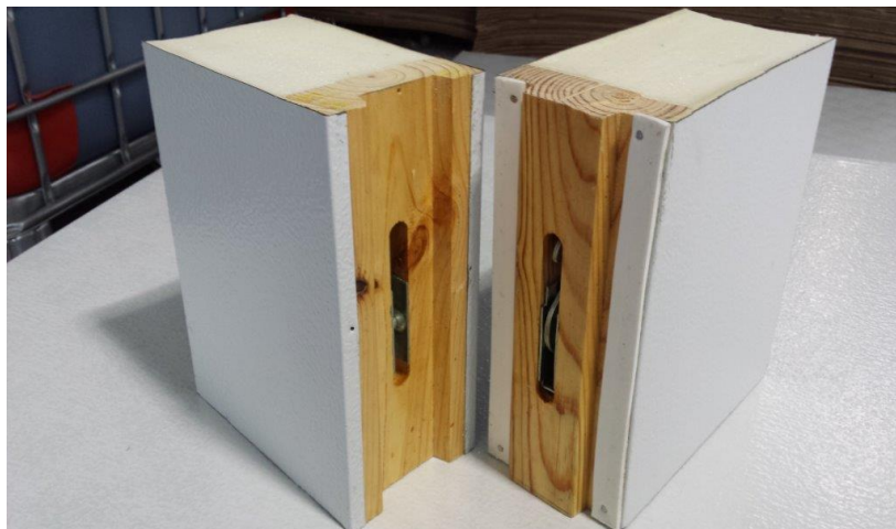
IMAGEN: PANELOCK 4" MADERA HyM