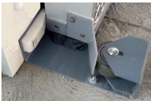
BASE CON RUEDADE EMPUJE PREUBICADA CON ANGULO DE CIERRE Y PROTECTOR DE EMPAQUE