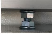
COLGADOR EN RANURA DE TROLLEY CON TUERCAS DE FIJACIÓN Y AJUSTE